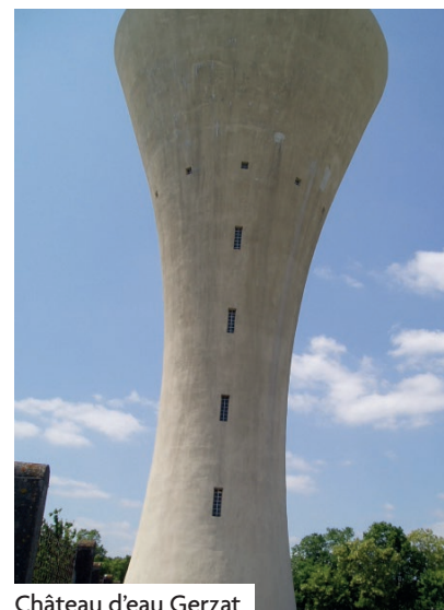
Château d'eau Gerzat