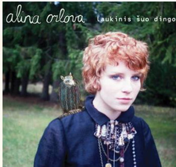
Laukinis Suo Dingo , 2008, Metro-Music (réédité en 2010 chez Fargo)