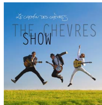
The Chèvres Show , autoproduit, septembre 2011

« La 'Première Tomme' du Chemin des Chèvres se savoure avec bonheur ! » Francofans