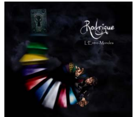
L'Entre-Mondes , absilone, mars 2011

« Complètement décomplexé et à l'aise dans son univers, ce chanteur est une bonne surprise dans le paysage hexagonal » Studyrama