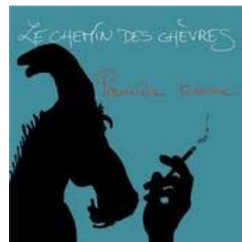
Première Tomme , autoproduit, novembre 2009