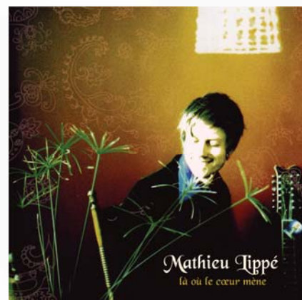
Là où le cœur mène , sorti en 2007