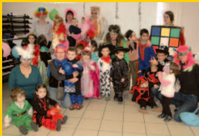
Relais assistants maternels