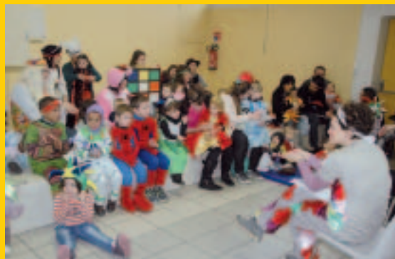
L'île aux câlins