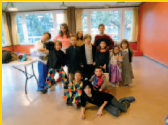
Accueil de loisirs

C ostumés, les enfants, parfois accompagnés des parents ont célébré mardi gras. A musés et excités, ils ont fait perdurer la tradition ! R iant aux éclats, les plus petits ont dansé et chanté, N aviguant dans les rues de la cité, les plus grands ont interpellé les badauds. A ttendrissant et touchant, ce petit monde s'est émerveillé. V irevoltant et chahutant, les personnages surprenants se sont amusés. A rc-en-ciel de couleurs, clowneries, fantaisie, réjouissance donnant un sentiment de... L iberté.