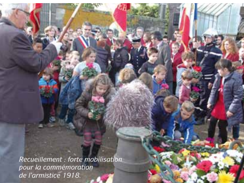
Recueillement : forte mobilisation pour la commémoration de l'armistice 1918.