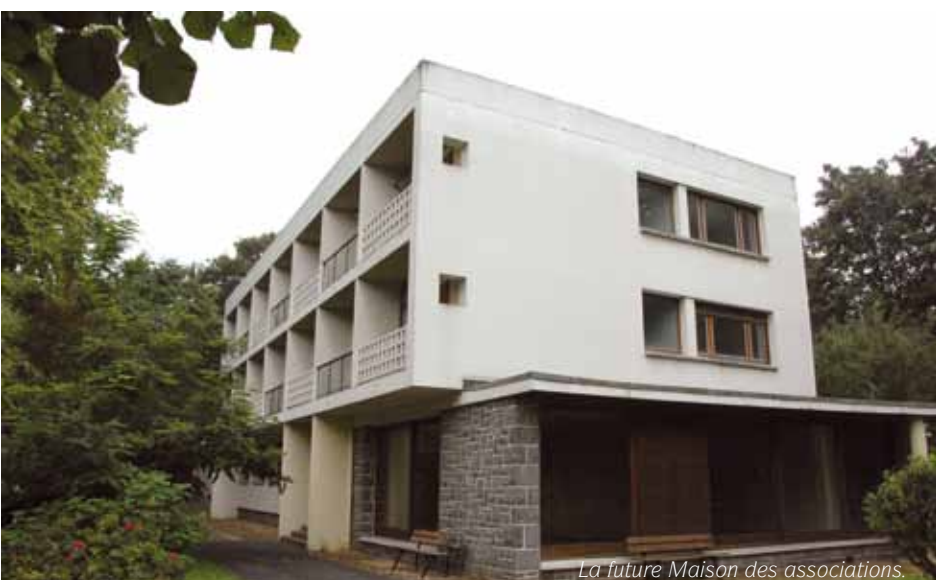
La future Maison des associations.