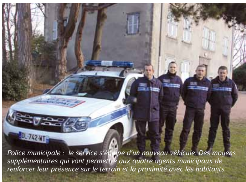
Police municipale : le service s'équipe d'un nouveau véhicule. Des moyens supplémentaires qui vont permettre aux quatre agents municipaux de renforcer leur présence sur le terrain et la proximité avec les habitants.