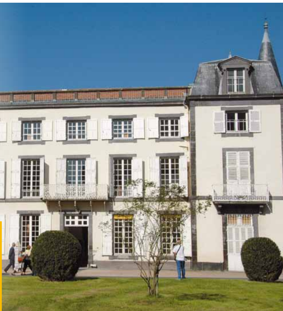
Le domaine de la Prade.

Cébazat représente aussi un territoire d'implantation séduisant pour les particuliers car il fait bon vivre dans notre commune. Ce dossier présente certains des grands projets qui façonneront notre futur, nous permettant de nous préparer à demain, de créer à Cébazat les conditions d'une ville agréable et attractive pour les entreprises et les habitants.