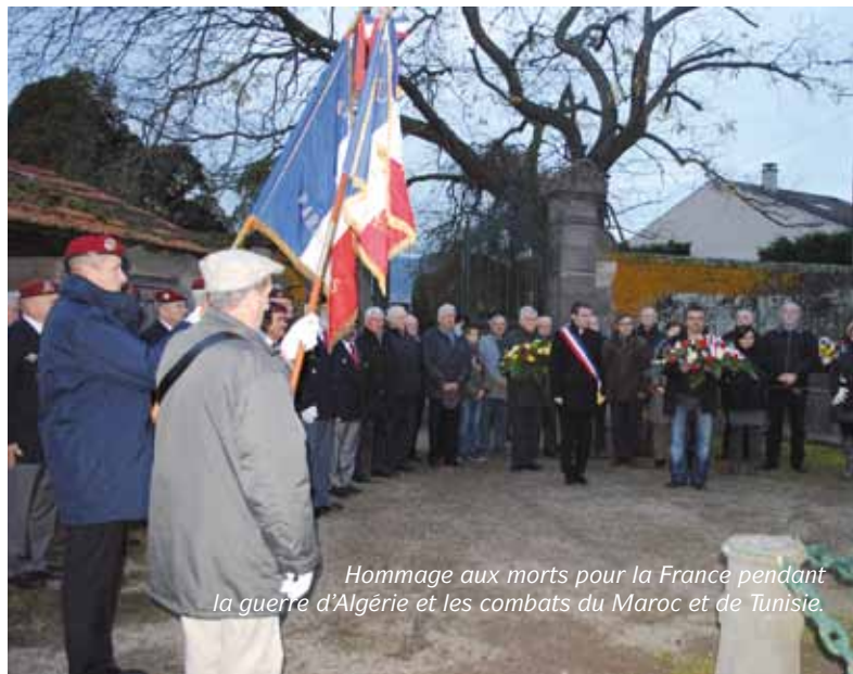
Hommage aux morts pour la France pendant la guerre d'Algérie et les combats du Maroc et de Tunisie.