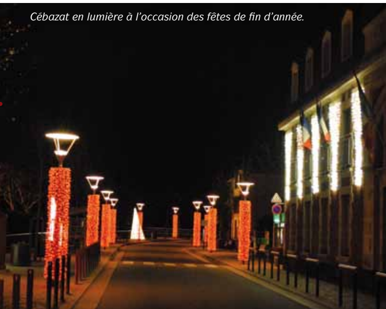
Cébazat en lumière à l'occasion des fêtes de fin d'année.