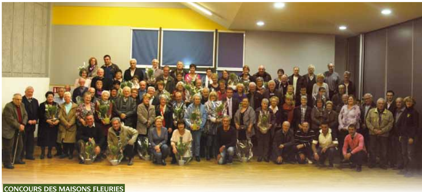
CONCOURS DES MAISONS FLEURIES