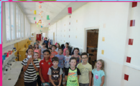
Un peu de couleurs dans les couloirs de l'élémentaire Jules-Ferry.