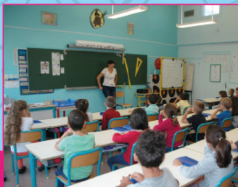
Nouvelle déco pour la classe de CE1 de l'école Pierre-et-Marie-Curie.