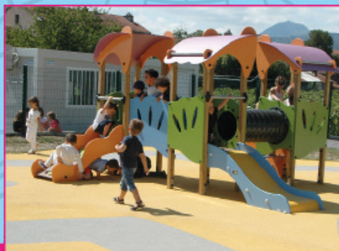
Plus de classes et de nouveaux jeux à la maternelle Pierre-et-Marie-Curie.