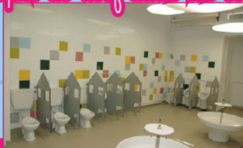
Des toilettes toutes neuves pour l'école maternelle Jules-Ferry.