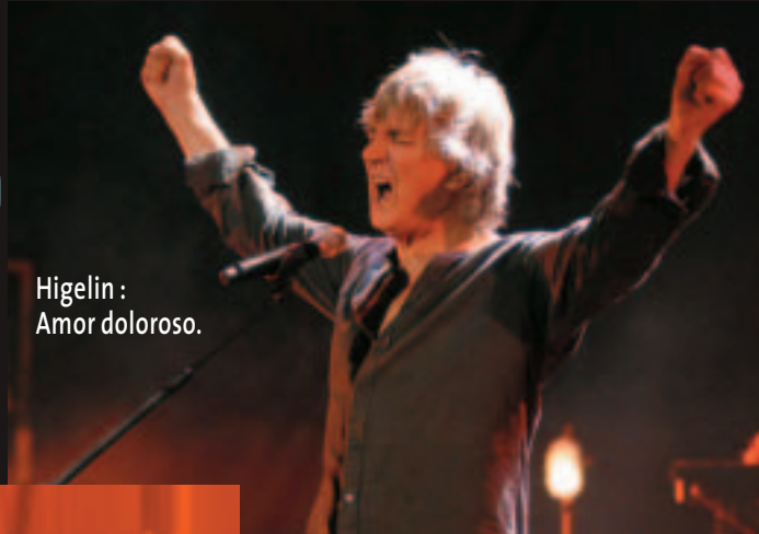
Higelin : Amor doloroso.