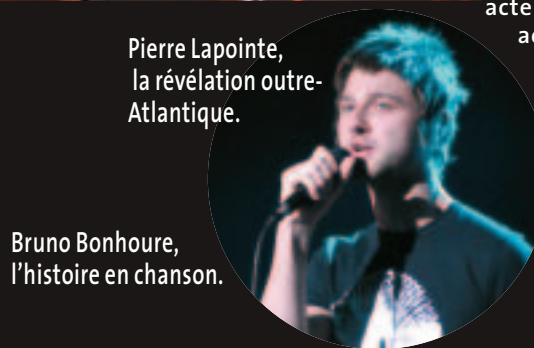
Pierre Lapointe, la révélation outre-Atlantique.