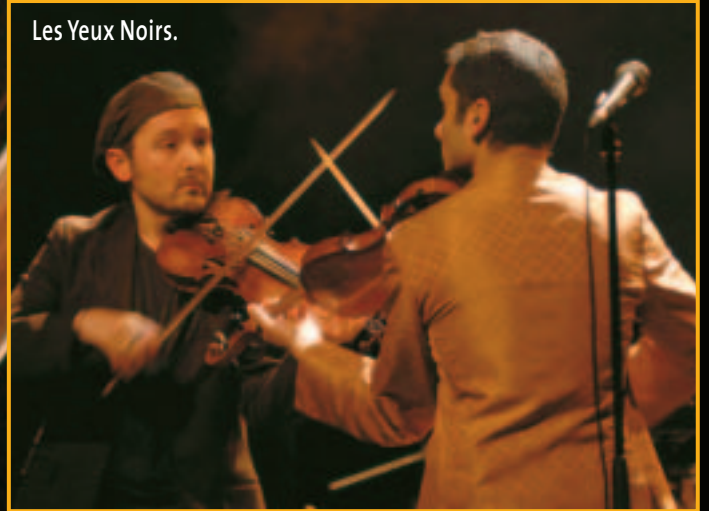
Les Yeux Noirs.