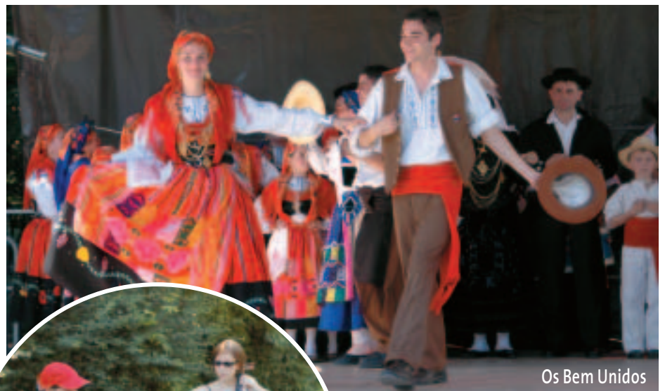
Os Bem Unidos

Mais la fête de la musique à Cébazat a aussi ses invités. Os Bem Unidos , une association de folklore portugais a proposé une démon-