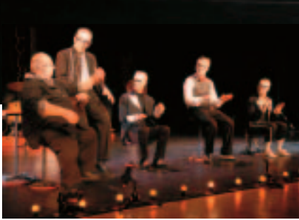
Les Nouveaux Nez.

Pourtant, cette saison est dans la même lignée que les précédentes et surtout construite avec le même esprit et la même passion.