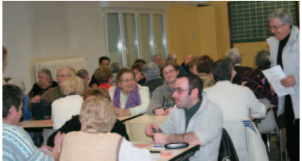
Salle comble lors du dernier concours de belote du Club Regain.

Lieu d'échange, de partage et de bonne humeur, le Club Regain propose des moments de détente, de loisirs et crée la rencontre entre amis, voisins et retraités.