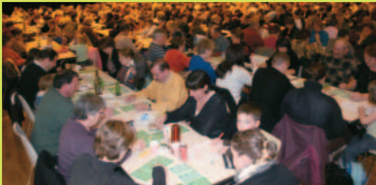
Loto de l'ARAC.

Une fois de plus, c'est un carton plein pour les associations qui organisent leur loto. Que ce soit les écoles, les clubs sportifs, le club des anciens ou encore les associations de quartier, ils ont tous du succès. On y retrouve les passionnés de jeux, les hyper-chanceux, les amateurs de moments de détente, les familles en vadrouille ou encore les adolescents, venus entre copains. Bref, des salles toujours pleines, à en pousser les murs, des gagnants toujours aussi nombreux et joyeux et une ambiance conviviale. Là est la clé du succès !