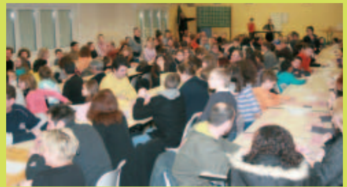
Loto de l'école Jules-Ferry.