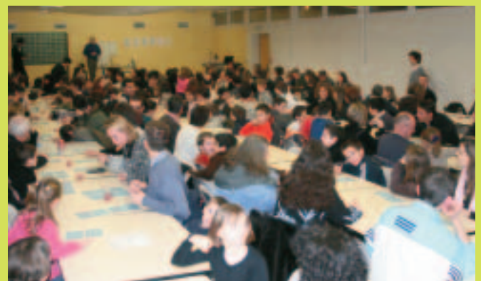
Loto de l'école Pierre-et-Marie-Curie.