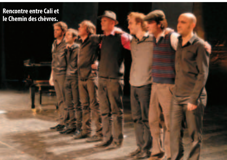
Rencontre entre Cali et le Chemin des chèvres.

Néanmoins, M. le Maire a annoncé qu'une réflexion était engagée pour réaliser des travaux visant à l'amélioration du confort du public et des artistes.