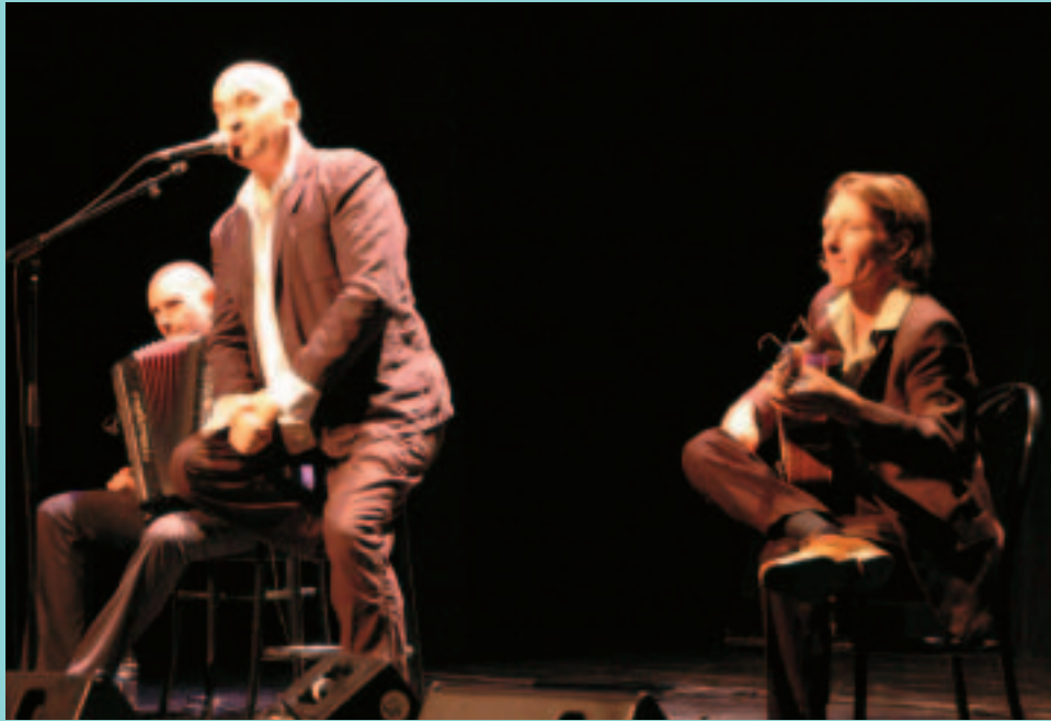
Intermède musical de Rue de la Muette.