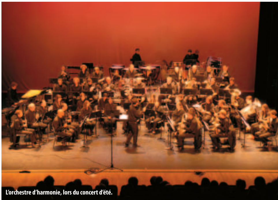
L'orchestre d'harmonie, lors du concert d'été.

L'école de musique finit sa rentrée et accueille pour cette nouvelle année près de quatre cent cinquante élèves inscrits. Tous les instruments semblent avoir la cote, les orchestres peuvent espérer de nouvelles recrues à tous les pupitres !