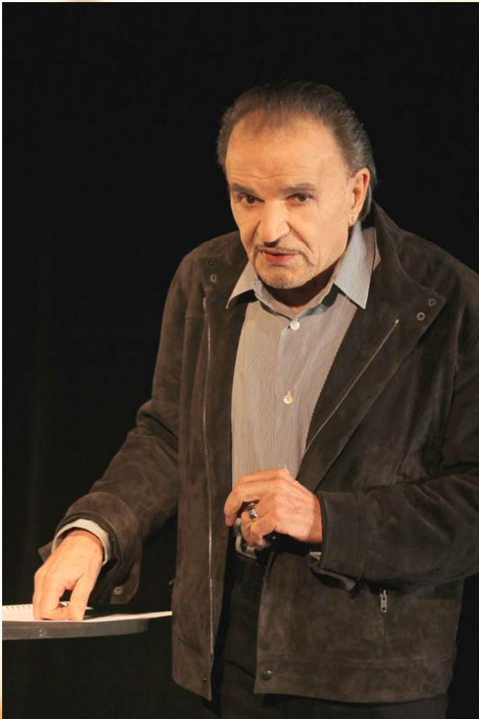
Jean-Pierre Kalfon, Audiard par Audiard, © Photo Lot

Jean-Pierre Kalfon , acteur énigmatique au regard noir et à la voix rocailleuse, trace le portrait de cet inventeur de style, magicien des mots.