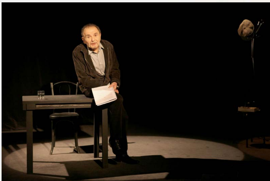
Jean-Pierre Kalfon, Audiard par Audiard , © Photo Lot