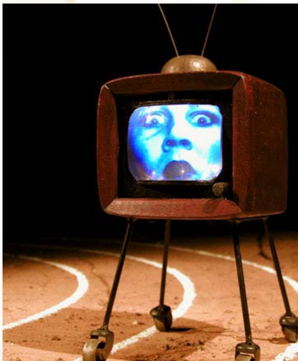
Installation vidéo de Tony Oursler

Du thème de la publicité découle bien évidemment tout un discours sur l'image et son pouvoir. Les apparences sont ici toujours trompeuses. Et nous voulons donner au spectateur des images fortes et surprenantes, déconcertantes et polysémiques. L'image sera déjà une des dimensions fortes de notre spectacle puisque nous travaillerons avec des marionnettes, des animaux et objets divers que nous allons mettre en mouvement. On est donc tout de suite au coeur même du sujet. Mais nous voulons aussi décliner l'image sous plusieurs autres aspects (cfr. Scénographie) et l'utilisation de techniques diverses de projection, telles que diapositives, photos, vidéos, dessins d'animation, affiches, peinture, est à l'étude.