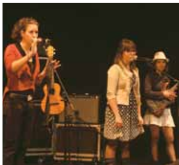
De Si De Là, prix du public.