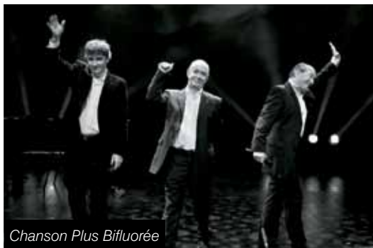
Chanson Plus Bifluorée