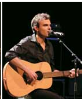
Lisidor, prix Claude-Miaille.