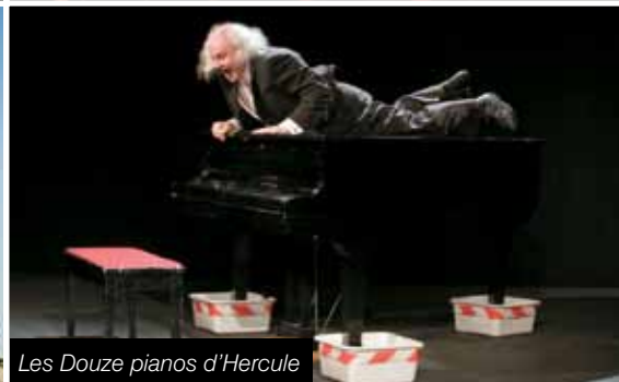
Les Douze pianos d'Hercule

Michel Navarro des Acrostiches ouvrira les festivités avec La Fugue de Jak que les enfants des écoles de Cébazat auront le privilège de découvrir avant la séance tout public du mardi 29 janvier à 20 h 30 ! Et c'est gratuit (sur réservation).