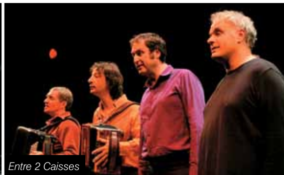
Entre 2 Caisses