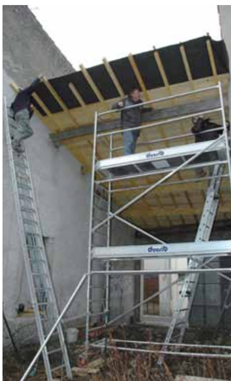
Réalisation d'une toiture.

Plusieurs travaux sont en cours sur la commune et sollicitent le savoir-faire de l'équipe du chantier d'insertion.